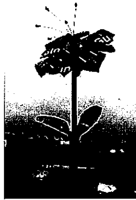
사진: 재활용품으로 만든 꽃 조형물

(다) '지속가능발전교육'을 통해 새로운 소재들이 다른 프로젝트들에 도입되는 경우가 많이 있다. 아래 사진은 이를 대표적으로 보여주는 독일의 사례이다. 공공장소에 설치된 이 조각 작품은 재활용품과 태양광 패널을 활용했다. 지속가능발전교육이 새로운 소재를 예술 프로젝트에 도입한 사례이다. 재활용 페인트를 사용하는 것에서부터 직접 만든 악기를 활용하는 경우까지 이러한 사례는 다양하게 찾아볼 수 있다. 지속가능발전교육은 소재의 선택 뿐만 아니라 재료와 그 활용방식에도 영향을 끼친다. 아래 사진을 다시 살펴보자. 조각은 소재와 더불어 그 중심의 아이디어도 함께 빌려온다. 폐기물과 재활용에너지의 결합 가운데 '꽃' 조각에 생명과 아름다움의 의미가 더해지게 된다. 이외에도 지속가능발전교육 콘텐츠를 사용하는 예는 다양하다. 청소년들이 지속가능개발에 대해 연극을 하고, 어린이들이 이 주제에 대해 그림을 그리거나 짧은 글을 쓸 수 있다. (출처: 에른스트 바그너, "문화예술교육과 지속가능발전교육")