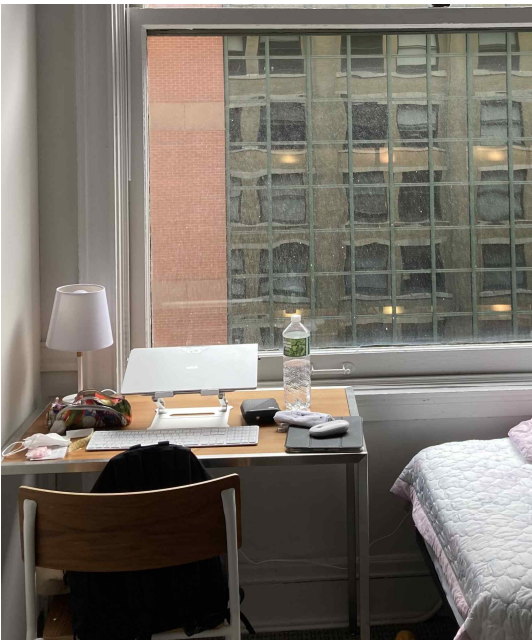
<기숙사 방 >

제가 머물렀던 방은 4인실이였으며 1인실 2개와 2인실 1개로 구성된 방이였고 저는 2인실을 사용했습니다. 2인실은 한방 안에 침대 2개, 옷장 2개, 책상과 의자가 2개가 있는 구조이며 따로 공간을 분리하는 칸막이 같은 것이 없었던 점이 불편하긴 했습니다.